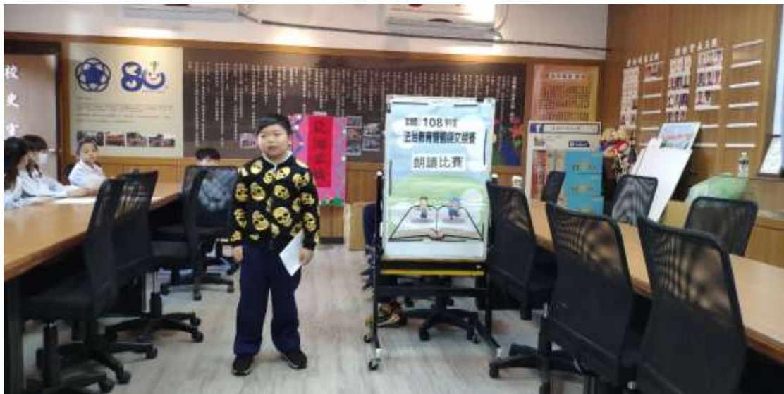
說明：辦理台語朗讀比賽 2，增進學生各項鄉土語言文字的認識與印象