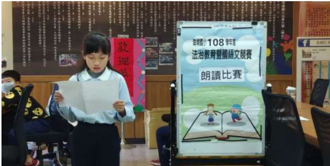
說明：辦理台語朗讀比賽 1，增進學生各項鄉土語言文字的認識與印象